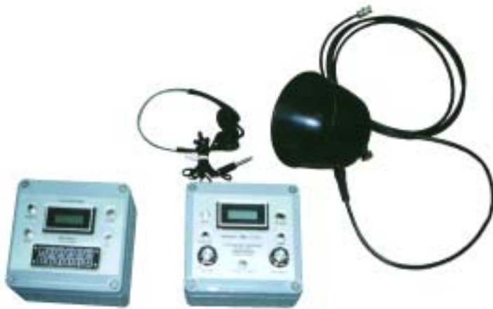
レシーバーとハイドロフォン