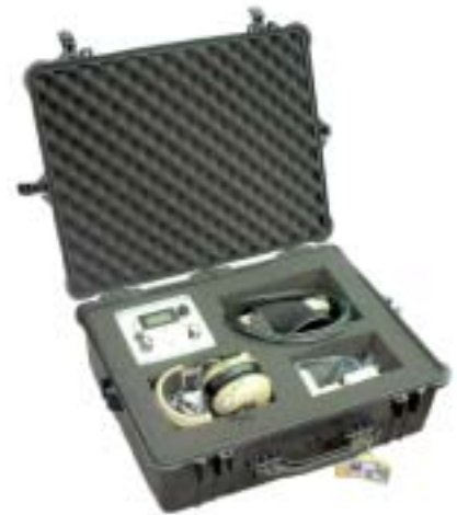
MANTRAK キット (マニュアルトラッキング 標準一式)

水中数百mから数キロmの範囲で水棲生物の行動を追跡するタグとして、あるいは器械の設置場所確認の為に利用されます。