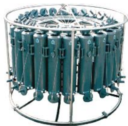
ロゼット採水装置に装着されたニスキン採水器