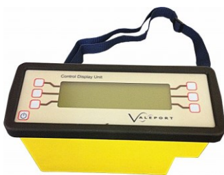
写真はコントロールディスプレイユニット